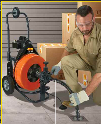
60cm lange Wellenführungs- feder